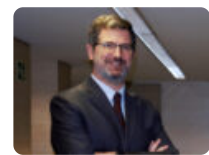
RocaJunyent consejo c en la inno sostenibil rentabili