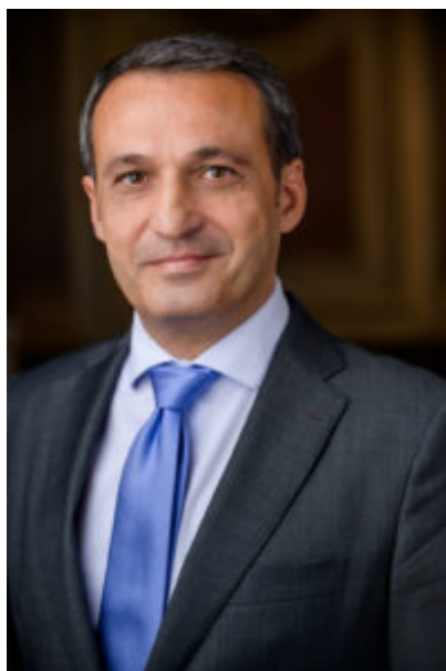
Frederic Munné, President del TAB.

La Junta Directiva del Tribunal Arbitral de Barcelona (TAB) ha decidit l'adhesió de la institució arbitral al projecte Compendium.cat , portal de recursos de llenguatge jurídic català que reuneix i indexa múltiples recursos lingüístics i jurídics pertanyents a tot el domini lingüístic català. El Consell de l'Advocacia Catalana lidera i impulsa el desenvolupament d'aquest portal, que també compta amb la col·laboració de diferents institucions com la Generalitat de Catalunya , la Universitat Pompeu Fabra o el conjunt de col·legis professionals d'àmbit jurídic. D'aquesta manera, el TAB reforça la seva aposta per la promoció i ús de la llengua catalana en l'àmbit arbitral. L'adhesió significarà que la institució arbitral i Compendium.cat duran a terme accions conjuntes de difusió i presentació d'aquesta eina a l'abast de tots els juristes.